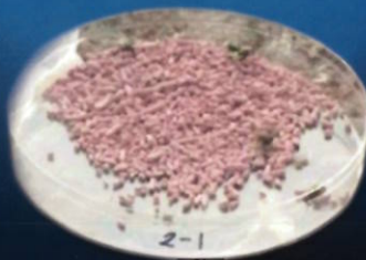
Kompetitor mengandung feromon & imidakloprid